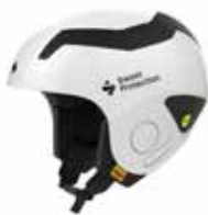
GSWHT Gloss White