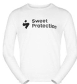
10001 Bright White