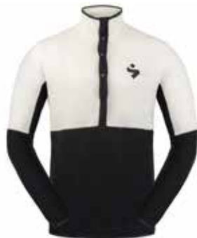
11003 Natural White [M]