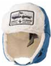
88300 Sky Blue