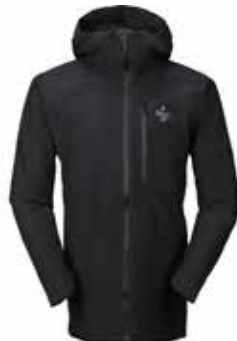
99901 Black [M, W]