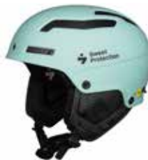
MTURQ Misty Turquoise