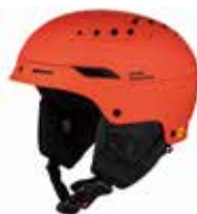
MBUOE Matte Burning Orange