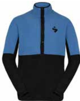
88100 Bluestone [M]