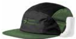
77003 Elm Green