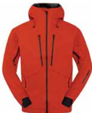
55505 Lava Red [M, W]