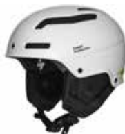
GSWHT Gloss White