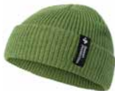
77003 Elm Green