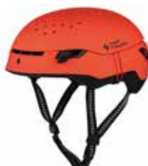
MBUOE Matte Burning Orange