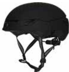
DTBLK Dirt Black

SIZE : S/M [53-56], M/L [56-59], L/XL [59-61] CERTIFICATIONS : CE EN 1077, CLASS B / EN12492; CE EN 1077 CLASS B / ASTM 2040 WEIGHT : 400 g [M/L] PRICE : ¥33,000_ [¥36,300]