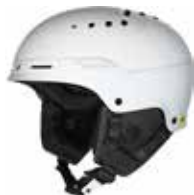
GSWHT Gloss White