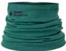
76100 Sea Green