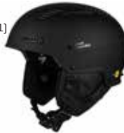
DTBLK Dirt Black