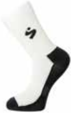
10001 Bright White