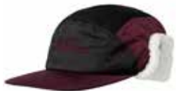
58000 Red Wine