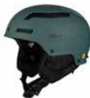
MASEM Matte Sea Metallic