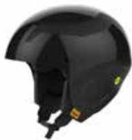
GSBLK Gloss Black

SIZE : S/M [53-56], M/L [56-59], L/XL [59-61] CERTIFICATIONS : CE EN1077 class A / ASTM2040 / FIS RH 2013 WEIGHT : 720 g [M/L] PRICE : ¥45,000_ [¥49,500]