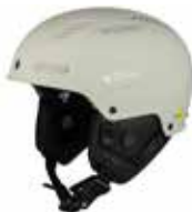
MBRW Matte Bronco White