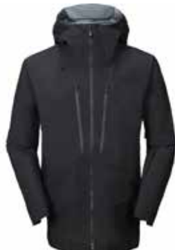
99901 Black [M, W]