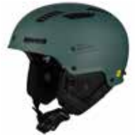
MASEM Matte Sea Metallic