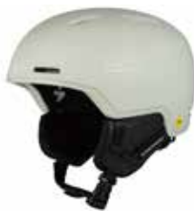
MBRWH Matte Bronco White