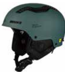
MASEM Matte Sea Metallic