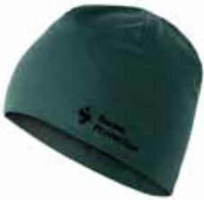
76100 Sea Green