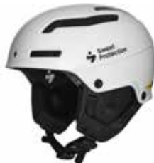
GSWHT Gloss White