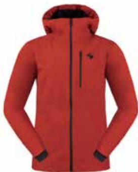
55505 Lava Red [M, W]