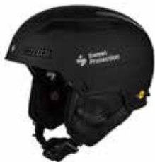
DTBLK Dirt Black

SIZE : S/M [53-56], M/L [56-59], L/XL [59-61] CERTIFICATIONS : CE EN 1077, CLASS B / ASTM 2040 WEIGHT : 700 g [M/L] PRICE : ¥55,000_ [¥60,500]