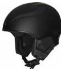
DTBLK Dirt Black

SIZE : S/M [53-56], M/L [56-59], L/XL [59-61] CERTIFICATIONS : CE EN 1077, CLASS B / ASTM 2040 WEIGHT : 595 g [M/L] PRICE : ¥90,000_ [¥99,000]