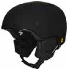
DTBLK Dirt Black

SIZE : S/M [53-56], M/L [56-59], L/XL [59-61] CERTIFICATIONS : CE EN 1077, CLASS B / ASTM 2040 WEIGHT : 455 g [M/L] PRICE : ¥32,000_ [¥35,200]