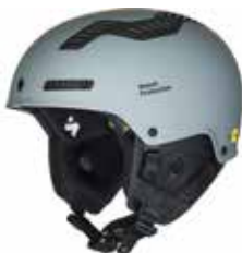
MNGRY Matte Nardo Gray