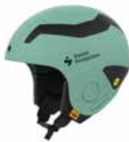
MTURQ Misty Turquoise