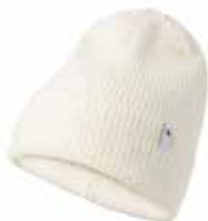
11003 Natural White