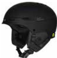
DTBLK Dirt Black