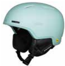
MTURQ Misty Turquoise