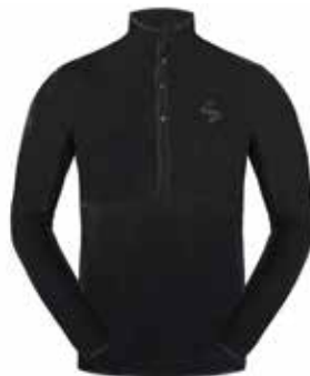
99901 Black [M]