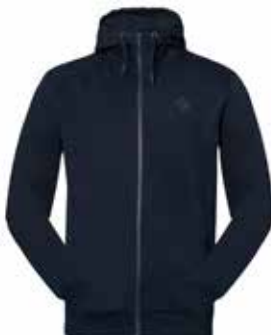
88000 Navy Blazer [M]