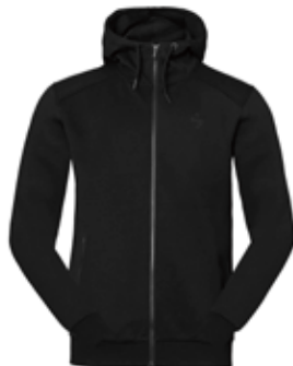
99901 Black [M]