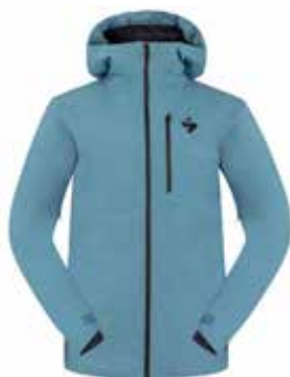
88200 Fine Blue [M]

SIZE : S-XL [Mens], XS-L [Womens] MATERIAL : Main fabric: Polyester 100%; Contrast fabric: Polyamide 92%, Elastane 8%; Fill: Polyester 100%; Lining: Polyamide 100%. WEIGHT : 710 g [Mens:L], 625 g [Womens:M] PRICE : ¥65,000_ [¥71,500]