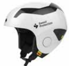
GSWHT Gloss White