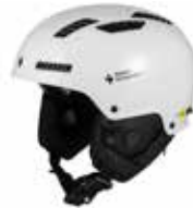
GSWHT Gloss White