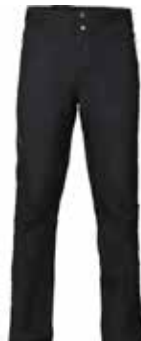
99901 Black [M, W]