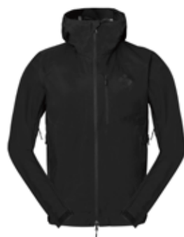
99901 Black [M, W]