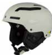
MBRWH Matte Bronco White