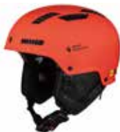
MBUOE Matte Burning Orange