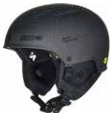
NACAR Natural Carbon