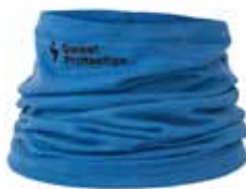
88300 Sky Blue