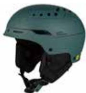
MBUOE Matte Sea Metallic