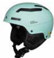
MTURQ Misty Turquoise