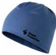
88300 Sky Blue