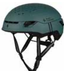
MASEM Matte Sea Metallic