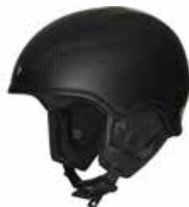
NACAR Natural Carbon

SIZE : S/M [53-56], M/L [56-59], L/XL [59-61] CERTIFICATIONS : CE EN 1077, CLASS B / ASTM 2040 WEIGHT : 595 g [M/L] PRICE : ¥100,000_ [¥110,000]