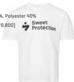
10001 Bright White