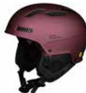
BARBM Barbera Metallic