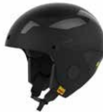
DTBLK Dirt Black

SIZE : S/M [53-56], M/L [56-59], L/XL [59-61] CERTIFICATIONS : CE EN1077 class A / ASTM2040 / FIS RH 2013 WEIGHT : 700 g [M/L] PRICE : ¥100,000_ [¥110,000]