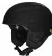
DTBLK Dirt Black

SIZE : S/M [53-56], M/L [56-59], L/XL [59-61] CERTIFICATIONS : CE EN 1077, CLASS B / ASTM 2040 WEIGHT : 700 g [M/L] PRICE : ¥50,000_ [¥55,000]