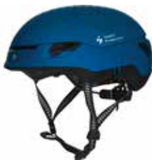
MBBLU Matte Bird Blue