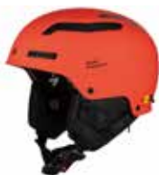
MBUOE Matte Burning Orange