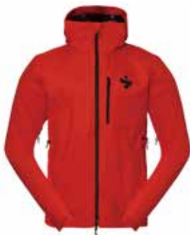
55505 Lava Red [M, W]