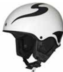
GSWHT Gloss White